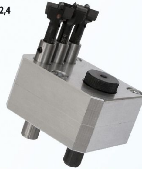
TRIMATIC SUPER 22,4

TRIMATIC 22,4 el brezyi veya sütunlu bir matkap kullanarak yeni mobilya konnektörü "Lamello® Cabineo®"yu takmak için tek seferde üç kör delik açmanıza olanak tanıyan delme aparatıdır. CNC freze makinelerine sahip olmayan mobilya üreticileri, hobiciler, ve zanaatkarlar için özel olarak üretilmiştir.